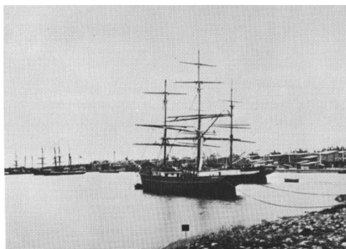
Hamnen vid Norrby skär, Ångermanland. Här låg Mo ångsåg och vidsträckt brädgårdar placerade på ett antal skär utanför fastlandet. De kvinnliga stuveriarbetare som arbetade här kom från Norrbyn, Hörnefors och andra samhällen i närheten beroende på det dåliga rykte som de fått påklistrat.