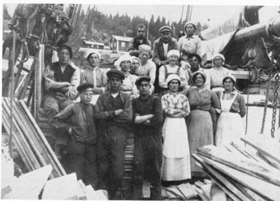
Lättare virkesslag, som låbräder och splitved, lastades ofta av kvinnlig arbetskraft. Till hjälp kunde de ha unga pojkar. Detta arbetslag ställde upp för fotografering omkring år 1920 på en skuta, som låg för lastning vid Ramviks sågverk.