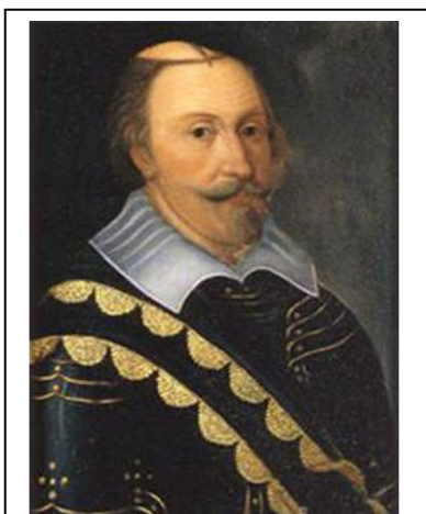
Hertig Karl, sedermera Karl IX, avbildad av okänd samtida konstnär.

Riksdagen 1595 i Söderköping beslöt att den tredje Vasasonen, hertig Karl, skulle vikariera som statschef när kung Sigismund, vistades i Polen. Han var ju kung även i det landet. Riksdagen beslöt att alla katolska präster skulle lämna landet inom sex veckor. Beslutet togs som en ed eller förening mellan de som var närvarande. De som vägrade gå med på detta skulle betraktas som rikets fiender. Beslutet trycktes och sändes ut till hela riket och överallt fick folk skriva att det stödde innehållet. Dokumentet anses vara landets första riksdagstryck. Klas Flemming som styrde över Finland godkände inte dokument utan tog bara order från Sigismund.