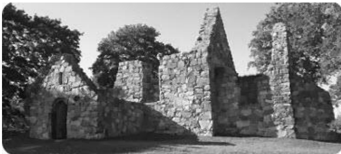
Kärnbo kyrkoruin. I eller vid kyrkan begravdes Abraham Angermannus 1608.

Människor är olika, visa är starkast på barriaderna men en katastrof i förvaltningen av det som vunnits, för andra är det tvärtom. En sentida släktings kommentar.