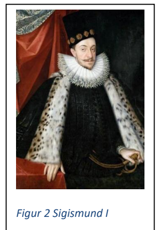
Figur 2 Sigismund I

Sigismund var son till Johan III och Katarina Jagellonica, sonson till Gustav Vasa i hans äktenskap med drottning Margareta , brorson till Erik XIV och Karl IX , kusin till Gustav II Adolf . Han gifte sig i maj 1592 med Anna av Österrike (1573–1598) och 1605 med dennas syster Konstantia av Steiermark (1588–1631).