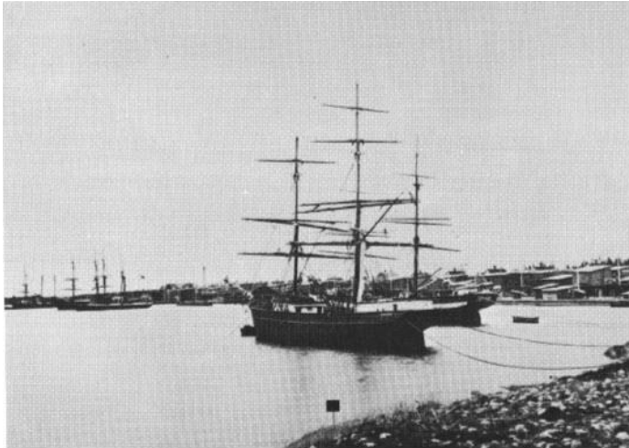
Hamnen vid Norrby skär, Ångermanland. Här låg Mo ångsåg och vidsträckt brädgårdar placerade på ett antal skär utanför fastlandet. De kvinnliga stuveriarbetare som arbetade här kom från Norrbyn, Hörnefors och andra samhällen i närheten beroende på det dåliga rykte som de fått påklustrat.